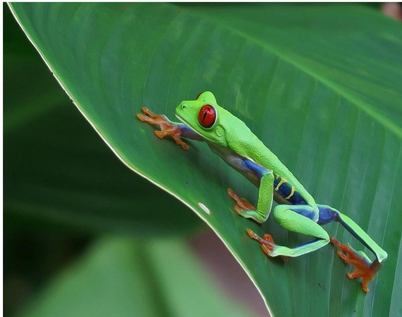
Agalychnis callidryas (Rotaugen-Laubfrosch)

Dieser Vortrag wird im heurigen Vereinsjahr ein besonderer Höhepunkt sein, weil wir die ungeheure Artenvielfalt in den Regenwäldern Costa Rica's erleben werden, interpretiert von einem ausgewiesenen Kenner der Fauna und Flora dieses Landes.