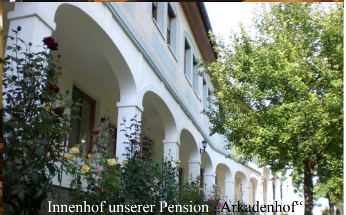
Innenhof unserer Pension „Arkadenhof“

Medieninhaber & Herausgeber: Gasthof Zentral, Obere Hauptstr. 1, A-7142 Illmitz. Tel. u. Fax: +43-2175/2312 arkadenhof.kroiss@gmx.at www.zentral-illmitz.at