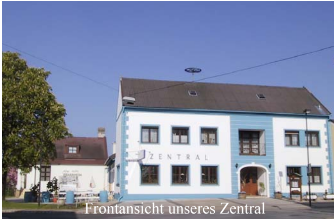
Frontansicht unseres Zentral

Ich habe schon so oft über unser Haus, unseren Hof und unsere Räumlichkeiten geschrieben, dass ich gar nicht mehr weiß, was noch darüber zu berichten wäre. Da Bilder sprichwörtlich oft mehr als tausend Worte sagen, hier einige Eindrücke aus dem „Zentral“.