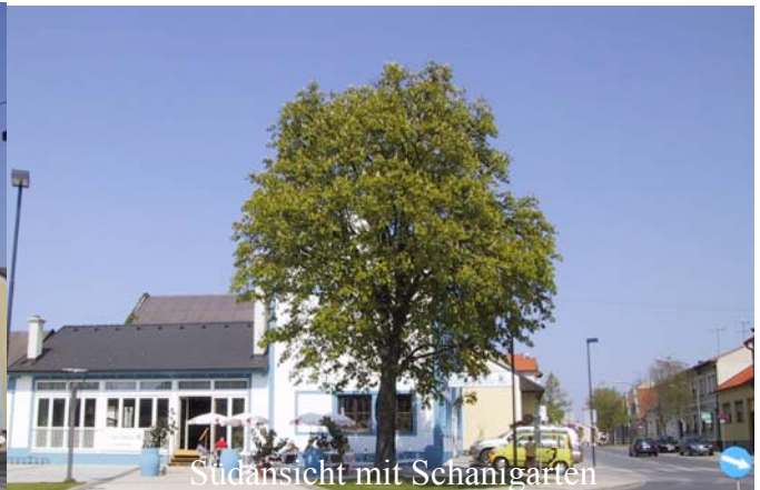
Südansicht mit Schanigarten